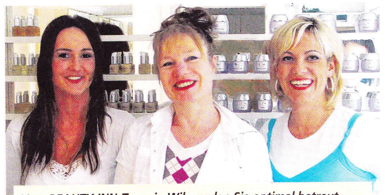
Vom BEAUTY-INN-Team in Wil werden Sie optimal betreut

Die allerneueste Technologie von der Proslimelt macht es möglich! Die Effizienz dieser Methode wurde in klinischen Studien nachgewiesen. Mittels spezieller niederfrequenten Ultraschall-Stosswellen werden Fett-